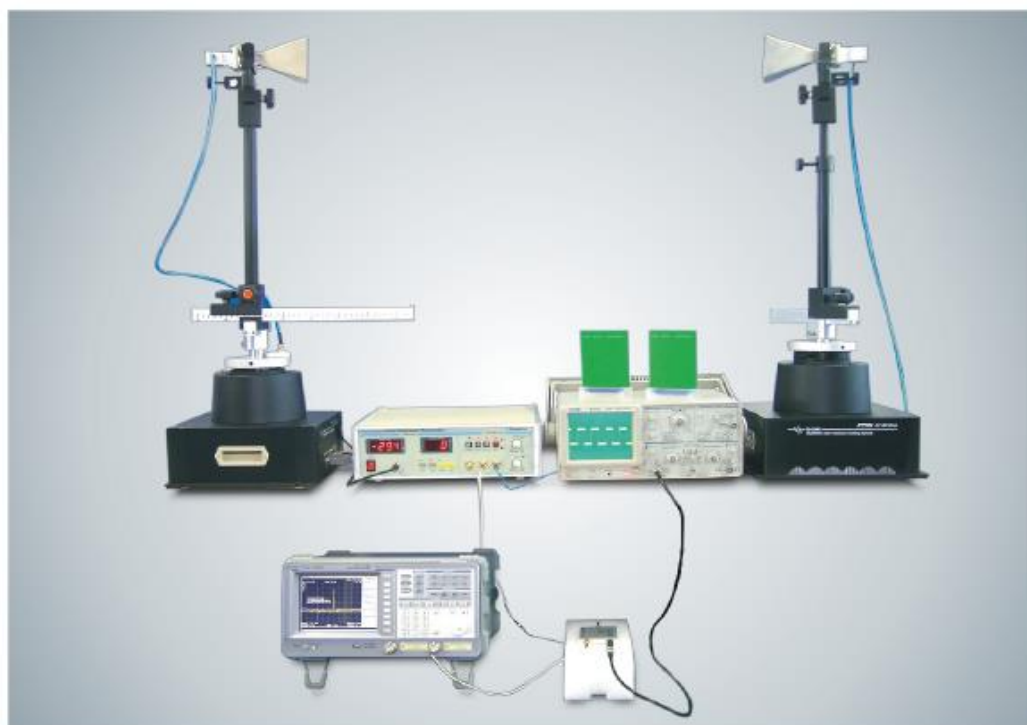
Типовая схема подключения элементов обучающего комплекса (антенны, устр-ва юстировки, кабели, контроллер-измеритель) и внешних средств измерений (анализатор спектра, осциллограф) для выполнения практических опытов